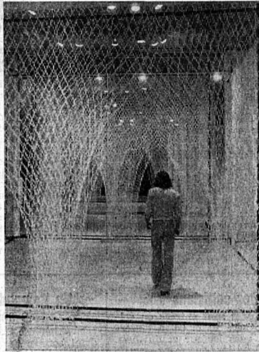
«Arcades» figure en bonne place au Centre international de Paris, où se tient une exposition consacrée à des tapisseries originales créées à l'atelier de l'église abbatiale de Ronceray, à Angers.