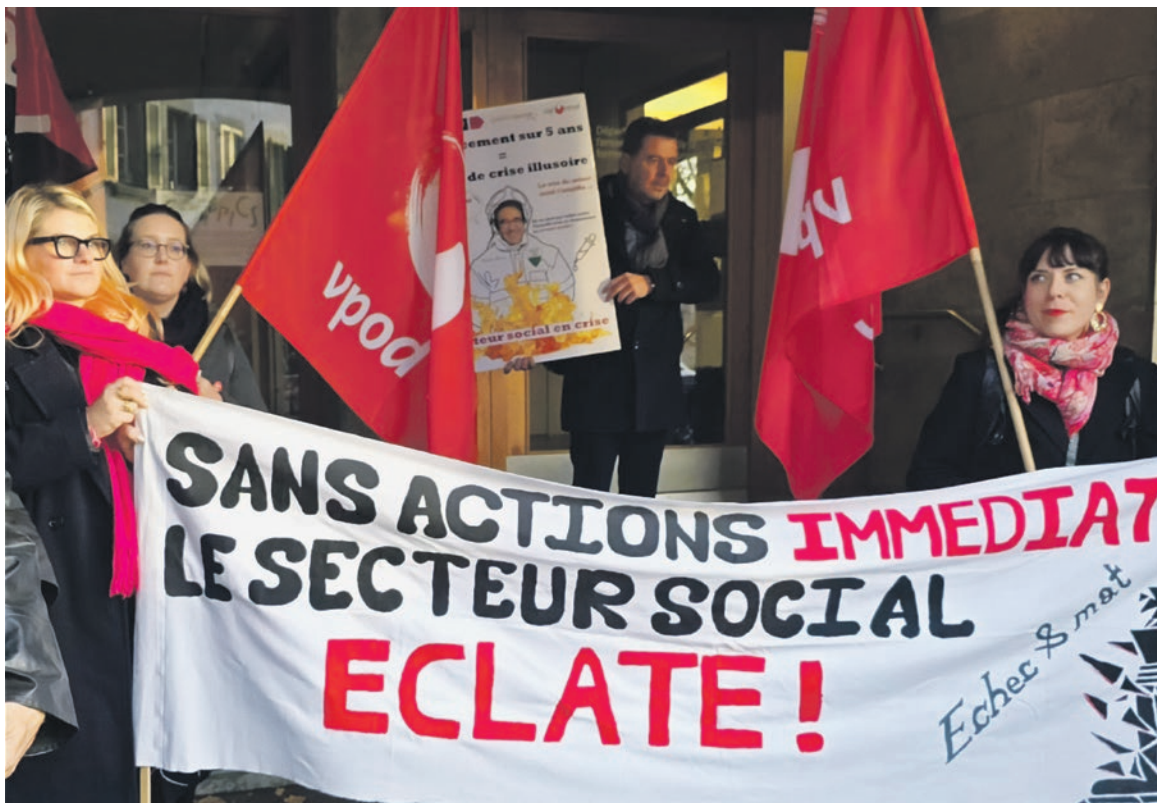
Manifestation du personnel du secteur social, Lausanne, 26 novembre 2024