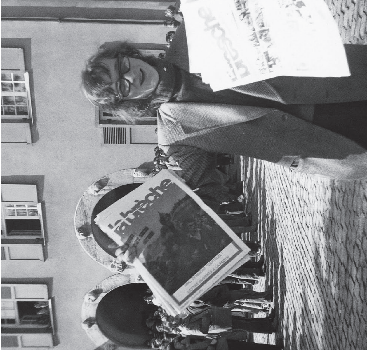
Occupation du gymnase des Alpes, Bienne, 1973. Document issu du tout nouveau site lmr-rml-biel-bienne.ch (voir page 14)