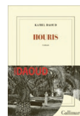
Kamel Daoud, Houris , Gallimard, collection Blanche, 2024