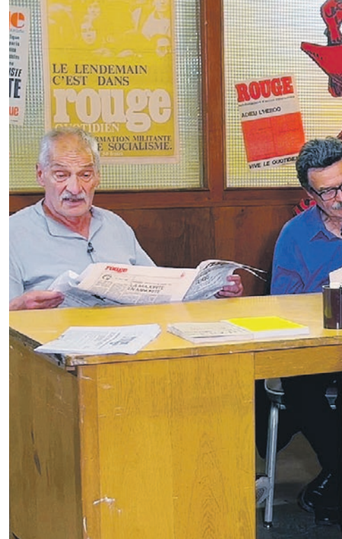
Des anciens collaborateurs du journal dans

1968 fut l'année de l'offensive indochinoise, de la grève générale en France, mais aussi du « prin-