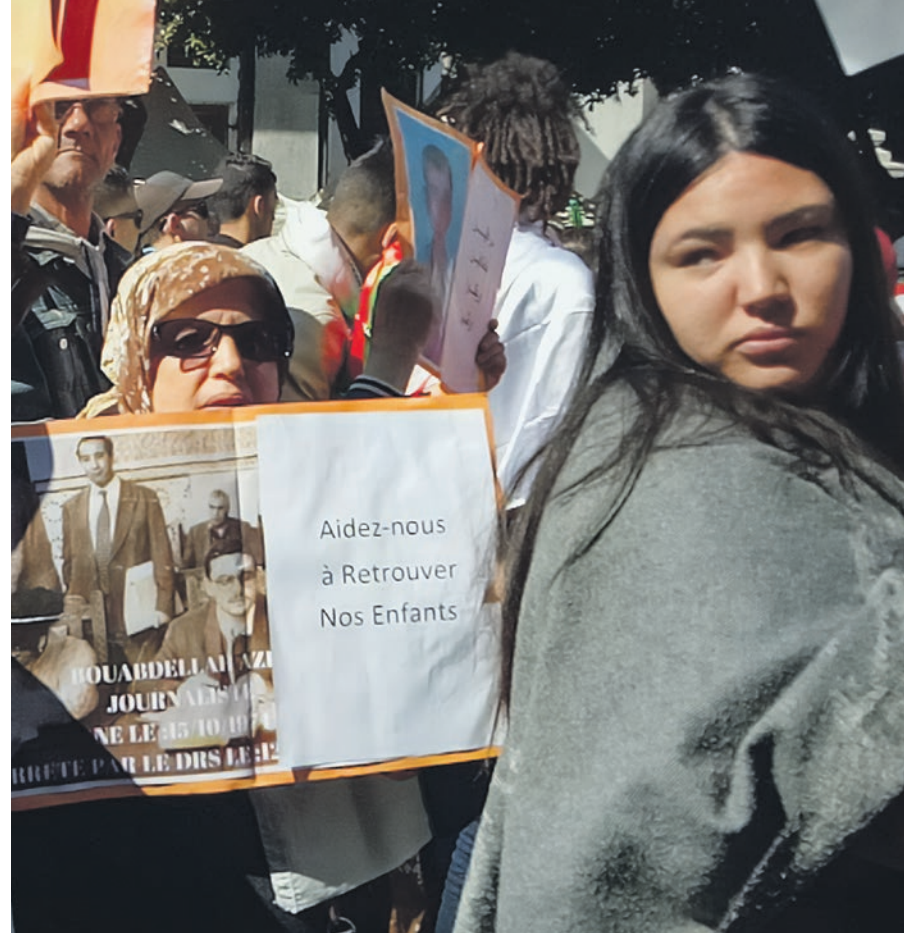
Les familles des disparu·es de la Décennie noire restent très actives. Manifestation durant le Hirak , Alger, 4 mars 2019.

Un débat sur cette œuvre a très vite pris, dès sa parution sur la liste Goncourt. Et pour cause : l'auteur, Kamel Daoud, Algérien exilé en France, dresse le portrait d'islamistes extrémistes de manière stéréotypée, des « barbus de Dieu », et d'un régime politique autoritaire très violent, surtout pour les femmes à qui toute liberté est refusée. Cette critique repose sur la crainte de voir le livre et sa médiatisation nourrir une interprétation xénophobe envers les pays francophones sud-méditerranéens. Dans le climat politique actuel de la montée effrayante de l'extrême droite en France, une lecture partielle de ce livre pourrait bel et bien forger une arme du discours idéologique post-colonialiste animalisant l'Algérie et sa culture. Un discours qui sacralise la démocratie européenne, qui promettrait, entre autres, « l'émancipation et la